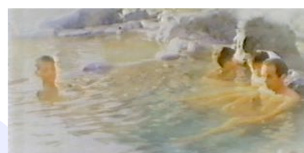
Badende in den heißen Quellen von Misasa