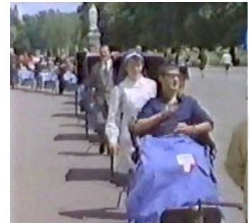
Die alljährliche Prozession von Tausenden Hilfesuchenden

Alljährlich zur Osterzeit beginnt die Pilgersaison in dem kleinen aber seit langer Zeit bekannten Ort Lourdes in den französischen Pyrenäen. Mehr als sieben Monate im Jahr begeben sich insgesamt fünf Millionen Besucher dorthin, um das Quellwasser von Lourdes zu trinken oder darin zu baden. Dieser Ort ist berühmt für seinen Wunderheilungen. Die meisten der Pilger sind Katholiken, von denen wiederum viele krank oder behindert sind. Die Geschichte von Lourdes beginnt 1858, Seit der Zeit zeigte sich, dass die Quellen von Lourdes bemerkenswerte Qualitäten besitzen. Es begann damit, dass eine Frau von der Lähmung ihrer Hand geheilt wurde, danach folgte eine Reihe weiterer wundersamer Heilungen und seitdem stellen sich unaufhörlich Menschenmassen in Lourdes ein. Bis heute wird von Heilungen von Tumoren, Tuberkulose, Augenerkrankungen, Hauterkrankungen, Bronchitis und Lähmungen berichtet.