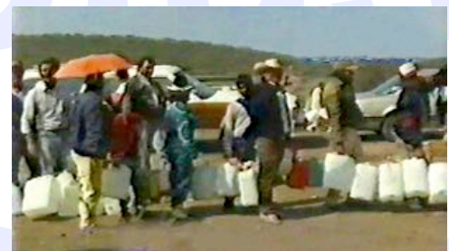
Kilometerlange Warteschlangen auf den Wegen